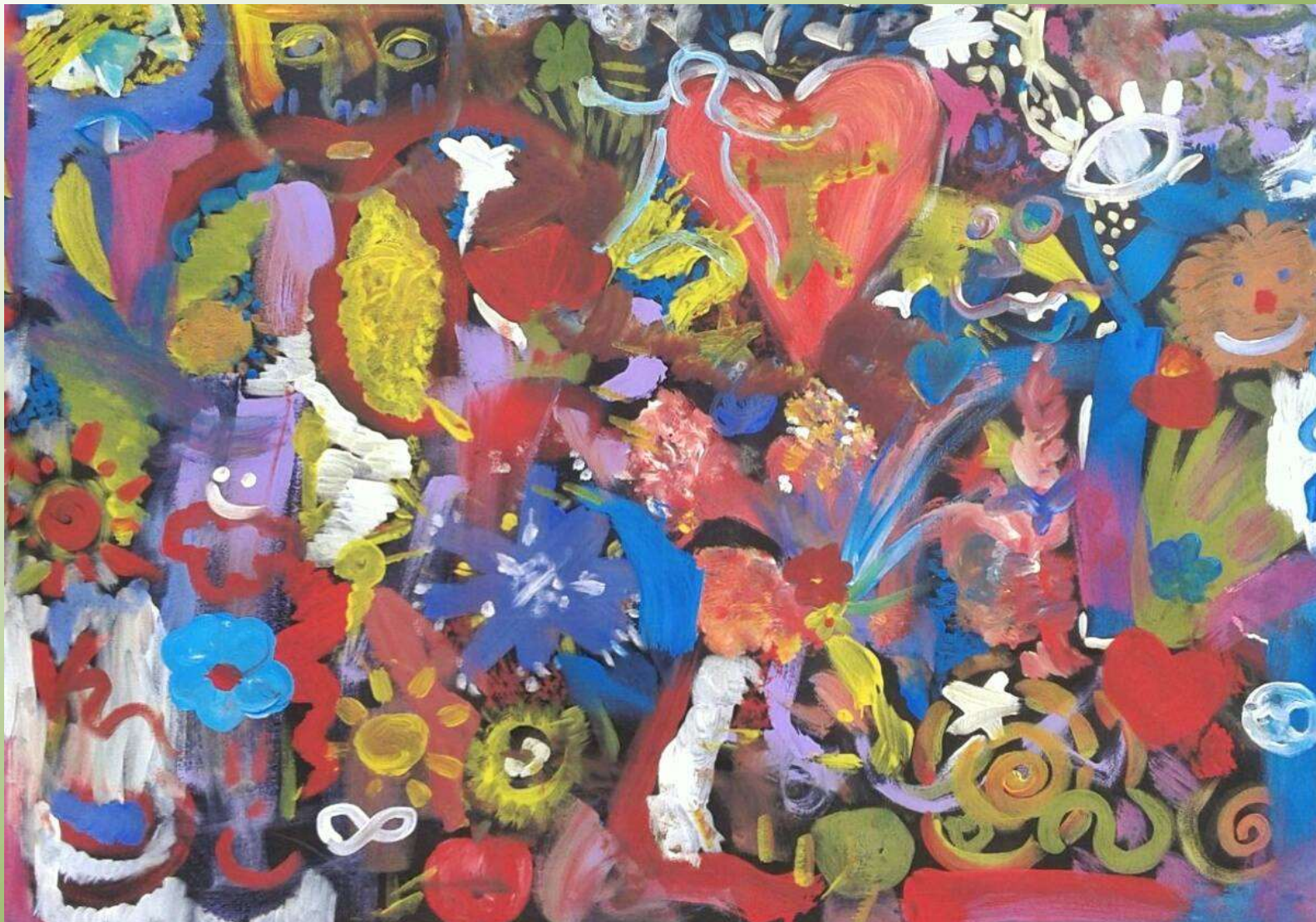
Quadro collettivo, 2015